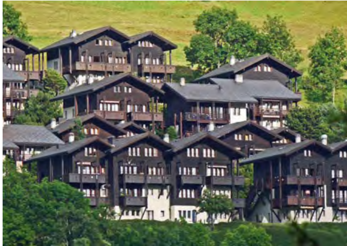
Arquitectura típica suiza en el Cantón de Valais.