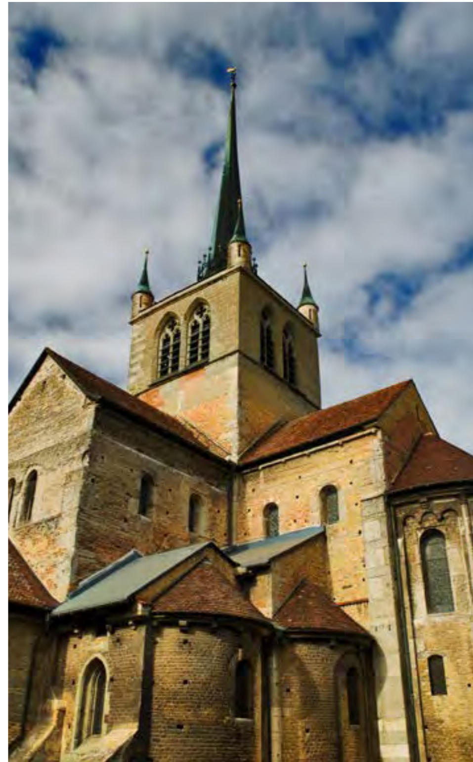
Iglesia en Payerne