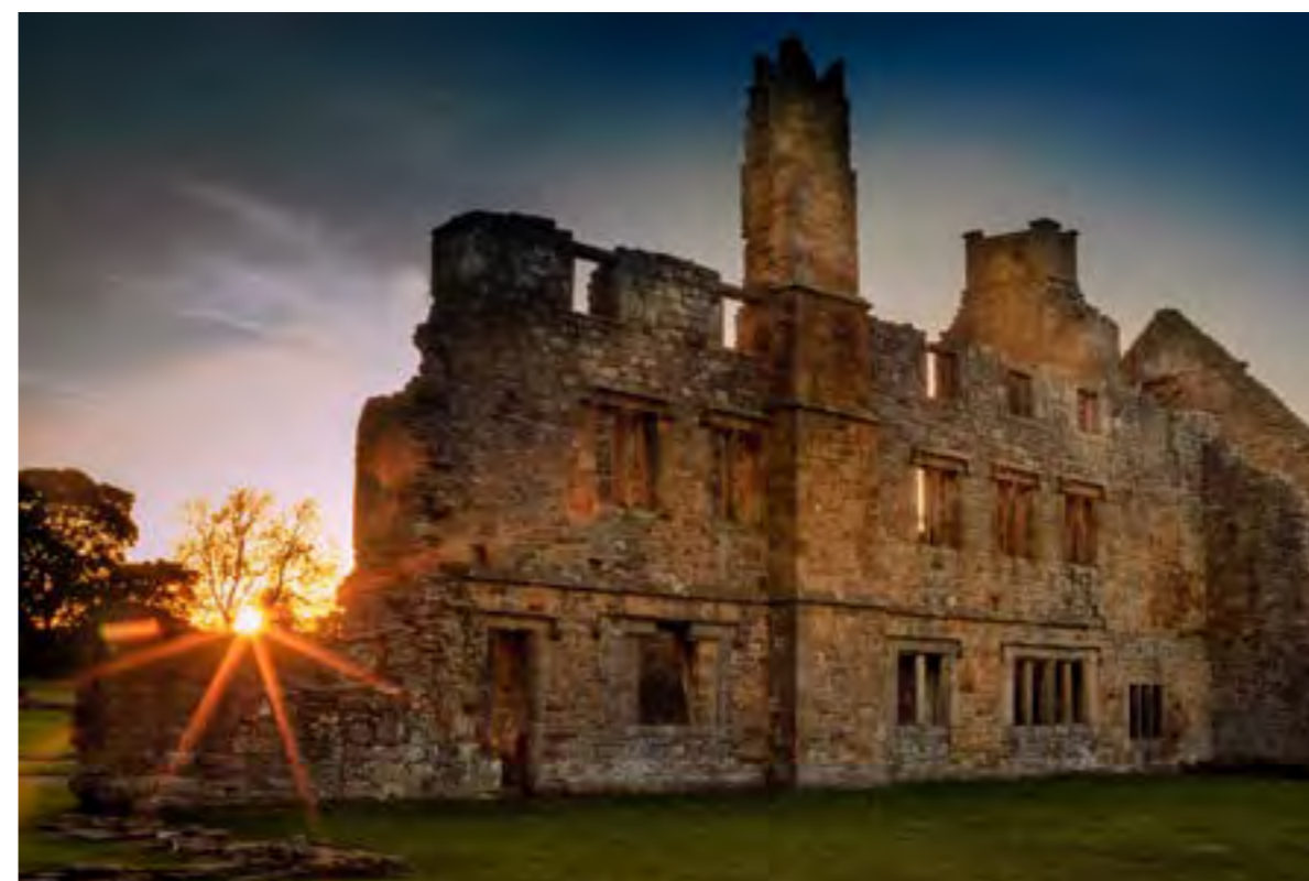
Abadía De Egglestone